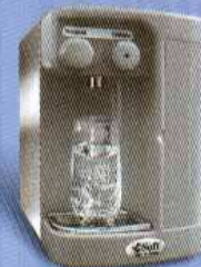
SOFT SLIM - INOX CINZA