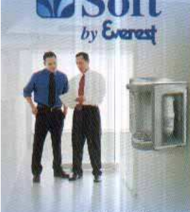
Soft INOX CINZA em parede

Dimensões: altura 40cm, largura 30cm e profundidade 36cm Peso Líquido: 12 kg Armazenamento de água gelada: 2 litros Temp. média de saída da água gelada: 8°C Pressão máxima para uso: 4 kg/cm 2 (acima de 40m de coluna de água há a necessidade de instalação da Válvula Automática Reguladora de Pressão). Capacidade de refrigeração: 2,2 litros/hora (15 pessoas/hora) c/ambiente a 32°C e água a 27°C. Tensão: 115V ou 220V (60Hz) Consumo: 100 watts