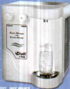
SOFT - INOX BRANCO