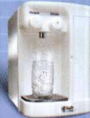
SOFT SLIM - INOX BRANCO