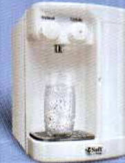
SOFT SLIM - BRANCO