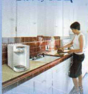
Soft Slim BRANCO em bancada