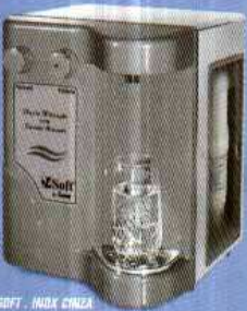
SOFT - INOX CINZA