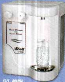
SOFT - BRANCO

O Soft by Everest é o mais eficiente purificador de água do mercado, desenvolvido com alta tecnologia, conta com eficiente sistema de filtração e alta capacidade de refrigeração. É indicado para uso residencial e comercial.